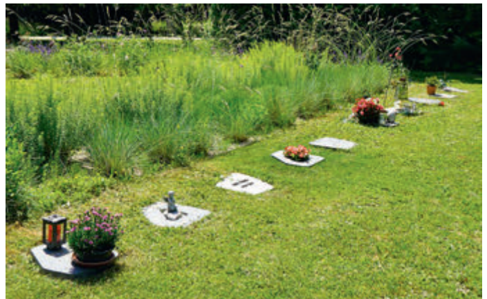
Die pflegeextensiven Urnengräber werden um etwa 192 Einzelgrabstätten erweitert. Fotos: MO

Unter Bäumen werden weitere 300 Urnenbestattungsmöglichkeiten geschaffen. MO