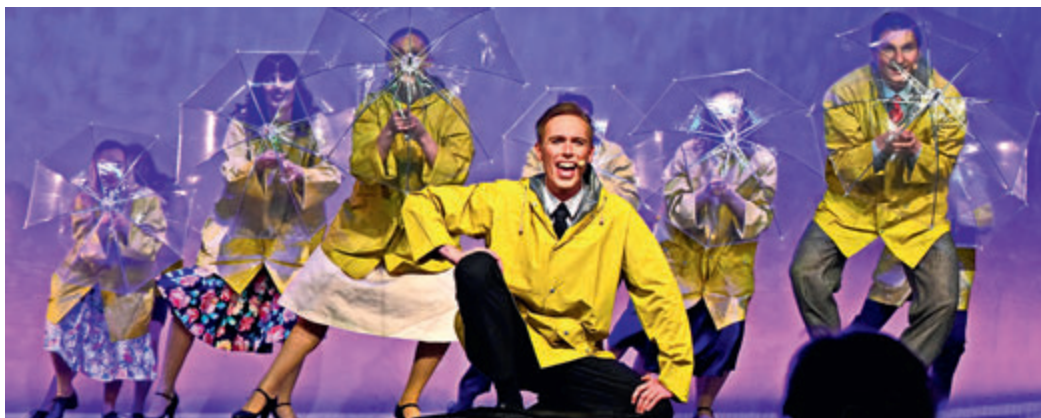
Die Abraxas Musical Akademie zeigt hier Ausschnitte aus dem Musical »Singin' in the rain«.