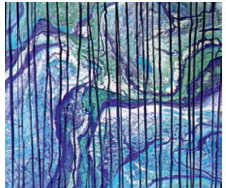
Das Bild mit dem Titel »Chopped on canvas 14« ist Teil der Ausstellung.