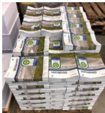
Palette mit 7.000 Exemplaren von Mein Ottobrunn .

Seit Anfang des Jahres wird Mein Ottobrunn in der Druckerei »Eder Druck« in Dachau produziert. Für den neuen Druckpartner mit zwölf Mitarbeitern ist diese Produktion mit einer Auflage von 14.200 Exemplaren einer seiner größeren regelmäßigen Aufträge; die Produktion dauert pro Ausgabe jeweils drei Tage. Neben einem guten Produkt steht für die Druckerei seit ihren Anfängen vor zehn Jahren eine umweltfreundliche Produktion im Vordergrund. Daher hat sich der Wochenanzeiger-Verlag als Herausgeber von Mein Ottobrunn bewusst für diese Druckerei entschieden. »Wir setzen mineralöl- und kobaltfreien Farben ein, und unser Papier stammt aus nachhaltiger Forstwirtschaft«, so Jürgen