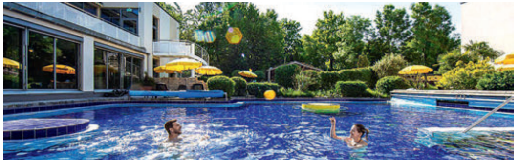
Endlich Sommer im Phönix-Bad: Das Außenbecken lädt zum Planschen ein.

Das Phönix-Bad hat seit Mitte Juni wieder geöffnet. Um alle Anlagen nach fast acht Monaten aus dem Dornröschenschlaf zu wecken, hat das Team nach Bekanntgabe des Termins noch einige Sonderschichten eingelegt. Das Besuchs- und Hygienekonzept unter dem Motto »Willkommen zuRÜCKsicht!« bringt einen entspannten Aufenthalt und den notwendigen Infektionsschutz bestens unter einen Hut.