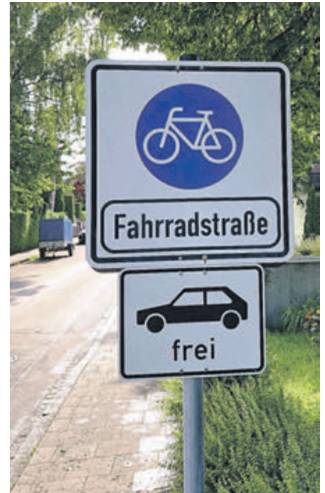
Vom Haidgraben kommend beginnt hier die neue Fahrradstraße.

Damit gibt es jetzt erstmals eine nahezu durchgängige, über weite Strecken vorfahrtsberechtigten West-Ost-Radtrasse vom Haidgraben bis zur Lenbachallee. Die Gutenbergstraße geht als neue Fahrradstraße in die schon länger bestehende Fahrradstraße Edelweißstraße über. Entlang beider Straßen sind sämtliche Einmündungsbereiche