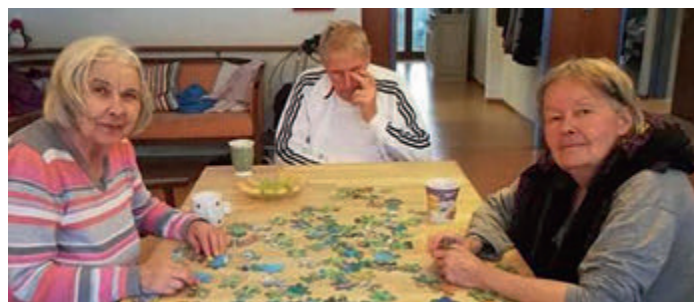
Die WG-Bewohner puzzeln gerne oder spielen Gesellschaftsspiele.