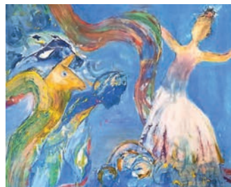
Dieses Bild ist Teil der Ausstellung.

Mit der Ausstellung »Bewegung« präsentiert die Künstlerinnengruppe »artso« noch bis zum 15. Mai ih-