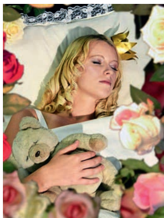
»Dornröschen« träumt von ihrem Prinzen.

Den neuen Spielplan und weitere Infos finden Sie unter www.wfh-ottobrunn.de . MO