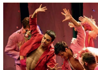
Das Publikum darf sich auf besondere Tanzszenen freuen.

Mit »Sommer.Nachts!Traum?« adaptiert das Tanzforum München Shakespeares unsterbliche Komödie zu einem burlesk-ver-