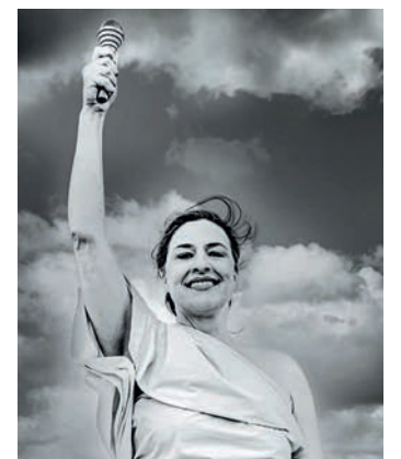
Kabarettistin Eva Eiselt als etwas andere Freiheitsstatue.