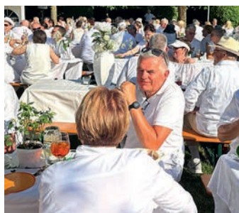
Das Fest findet heuer bereits zum vierten Mal statt.

Am Freitag, 5. Juni findet ab 17.00 Uhr das nächste Weiße Fest im Rosengarten statt. Wichtig ist