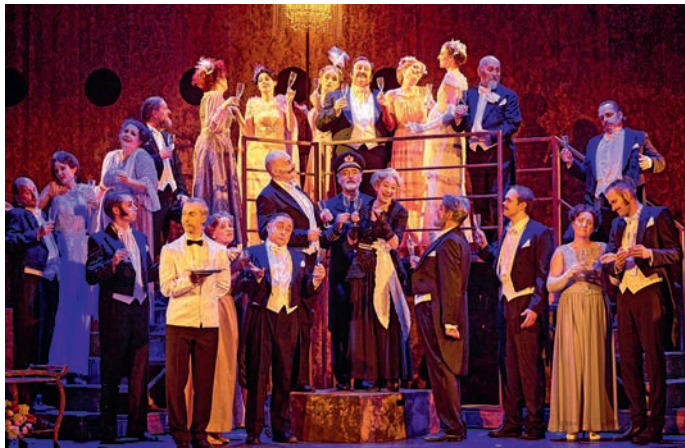
Die erste Klasse im Musical »Titanic«

Zum 37. Mal findet am 1. August das Kultur-Sommerfest mit Musik, Tanz, Comedy und Akrobatik im Rosengarten statt. Auch heuer ist es wieder Teil der mehrtägigen Open-Air-Veranstaltungsreihe »Ottobrunner Sommer. So können Sie am 30. Juli mit der »Gol-