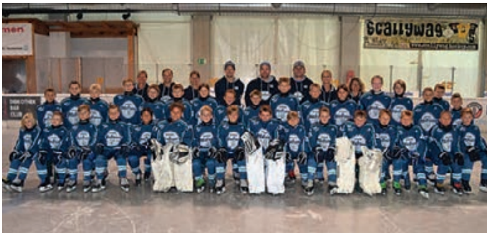
Mit gleich zwei Mannschaften konnte sich die U11 durchsetzen und die Saison als Meister abschließen.