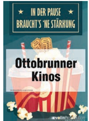
Unterstützen auch Sie das Ottobrunner Kino!

Um Kinos in der besucherlosen Zeit zu unterstützen, hat sich die für Kinowerbung in Bayern zuständige evolin Produktion GmbH für ihre Vertragskinos eine besondere Aktion einfallen lassen: Unter dem Motto »In der Pause braucht's 'ne Stärkung – #packmaswieder« können Kinofans Gutscheine für Snack-Packages zum halben Preis erwerben. Den Restbetrag der Verzehrgutscheine übernimmt evolin. Der Erlös geht komplett an die Kinos; unter anderem auch ans Ottobrunner Kino. Die Gutscheine gibt es unter www.packmaswieder.de .