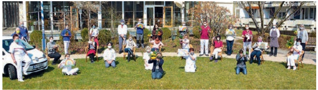
Das gesamte Team dankt allen, die das Haus in den letzten Wochen so sehr unterstützt haben.

Ein besonderer Dank geht an die vielen Kinder, die durch ihre Regenbogenbilder das Hanns-Seidel-Haus bunt gemacht haben. Für Nervennahrung haben die Fir-